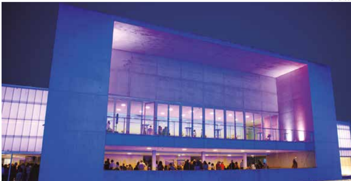
Características e localização do espaço estão a atrair diferentes eventos externos

Ainda há pouco reabriu, mas a procura pelo Centro de Congressos de Lagoa, antigo Pavilhão do Arade, está a ser alta e até surpreendente. São várias as entidades que têm contactado a Câmara Municipal para promoverem diferentes iniciativas na infraestrutura e, soube o Lagoa Informa, estão já várias datas reservadas até ao final do ano.