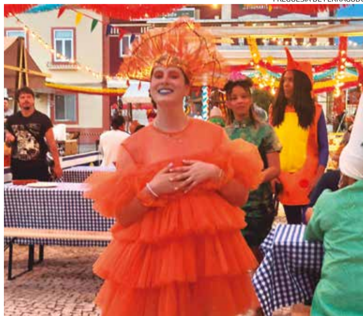
FREGUESIA DE FERRAGUDO

Esta já não é a primeira vez que Ferragudo e Lagoa são esco-